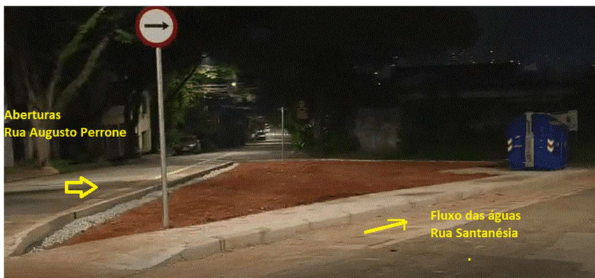
Jardim de chuva em construção Rua Santanésia x Rua Augusto Perroni mostrando fluxo das águas e aberturas