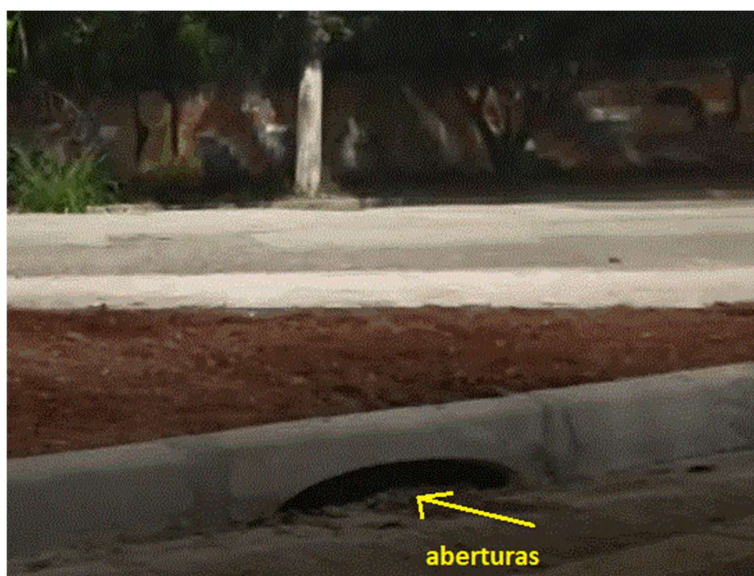
Jardim de chuva em construção Rua Santanésia x Rua Augusto Perroni mostrando aberturas na Rua Augusto Perroni onde o fluxo das águas é menor.