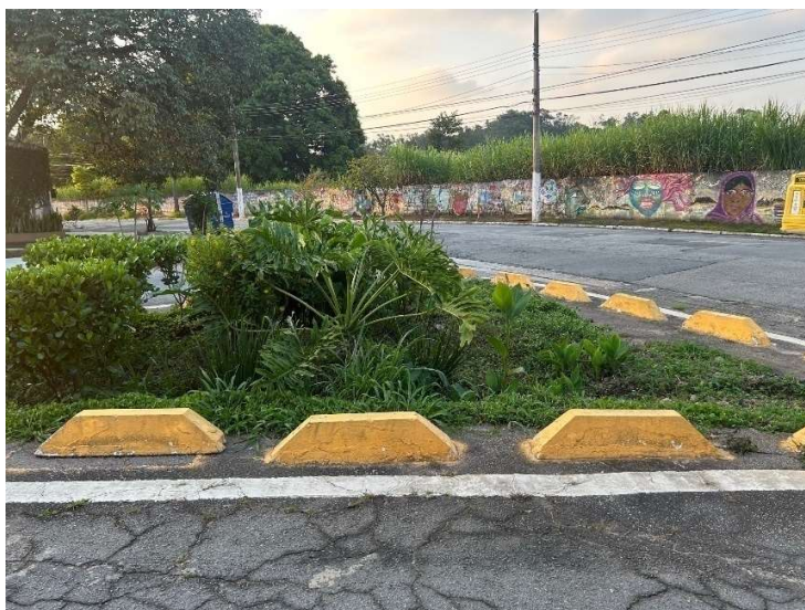
Jardim de Chuva Rua Santanésia x Rua Ernani Gama Correa. Entrada livre do fluxo da água, jardim abaixo do nível da rua.